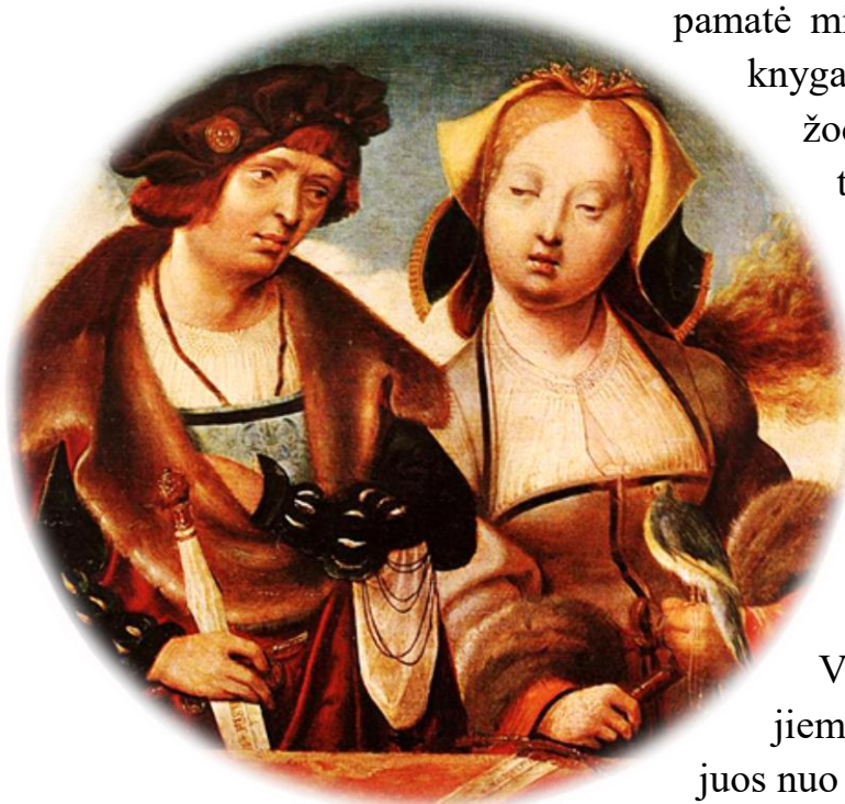
Šv. Cecilija ir jos sužadėtinis Valerijonas (apie 1520).

pamatė mielą senuką, apsirengusį baltais rūbais, su knyga, kurioje auksinėmis raidėmis buvo parašyti žodžiai: "Yra vienas Viešpats, vienas tikėjimas, vienas Krikštas, vienas Dievas ir Tėvas visų ir visuose" (Ef 4,5-6). Šv. Urbonas pamokė Valerijoną tikėjimo tiesų ir jaunuolis priėmė iš jo rankų šventą Krikštą. Kada grįžo į Cecilijos namus, pamatė ją nuoširdžiai besimeldžiančią, o prie jos stovėjo angelas, kuris rankose laikė du vainikus – iš rožių ir lelijų, kuriuos uždėjo ant Valerijono ir Cecilijos galvų. Tuomet angelas jiems pasakė: "Šiuos vainikus saugokit, nes aš juos nuo Dievo atnešiau jums".