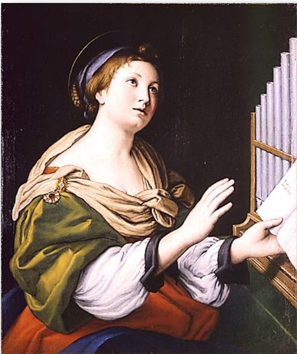
Guido Reni. Šv. Cecilija (apie 1606, Norton Simon muziejus, Pasadena, JAV)

Šv. Cecilija nuo Viduramžių laikų laikoma muzikos globėja dėl to, kad ji girdėjo dangiškąją muziką savo širdyje. Bažnytiniame mene Šv. Cecilija vaizduojama su rožėmis, muzikos instrumentais – vargonais arba smuiku.