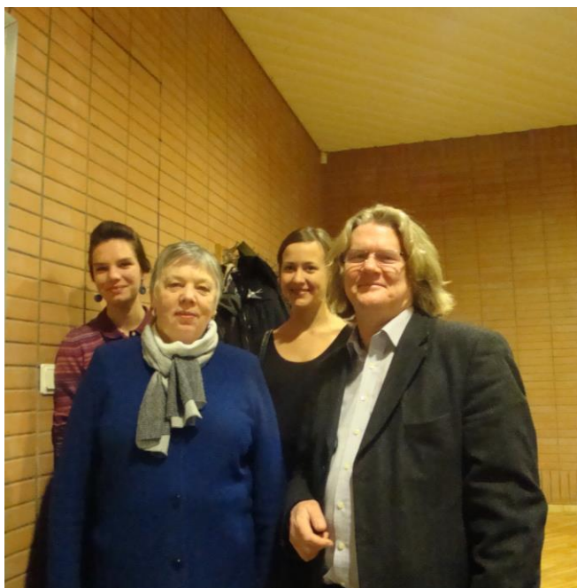
Susitiko skirtingų kartų atstovai: mokytoja ir jos mokinys, vėliau tapęs mokytoju, kartu su savo mokiniais.