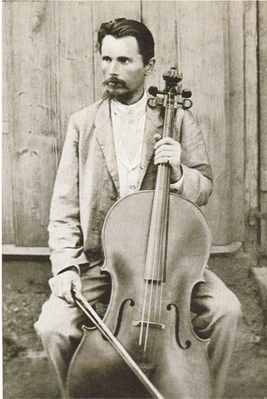
VINCAS KUDIRKA 1858 - 1899

Lietuvos himno „Tautiškos giesmės“ sukūrimo 115-ųjų ir Vinco Kudirkos 155-ųjų gimimo metinių proga koncertą Signatarų namuose gruodžio 20d. surengė Vilniaus muzikos mokykla „Lyra“