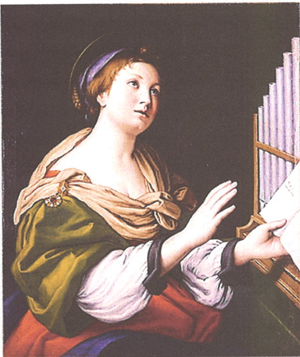
Guido Reni. Šv. Cecilija (apie 1606, Norton Simon muziejus, Pasadena, JAV)

Šv. Cecilija nuo Viduramžių laikų laikoma muzikos globėja dėl to, kad ji girdėjo dangiškąją muziką savo širdyje. Bažnytiniame mene Šv. Cecilija vaizduojama su rožėmis, muzikos instrumentais – vargonais arba smuiku.